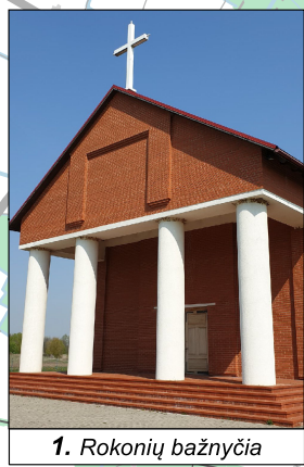
1. Rokonių bažnyčia