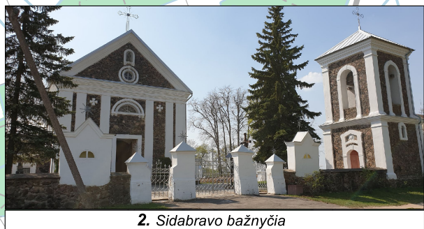
2. Sidabravo bažnyčia