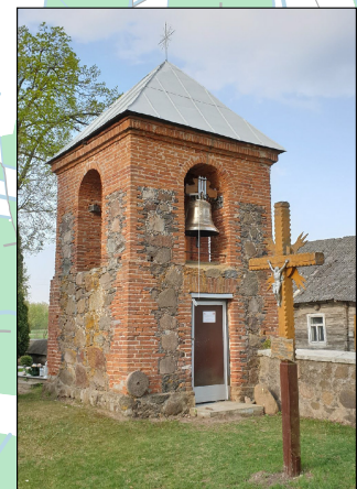
1. Vadaktų Šv. Agotos bažnyčios varpas