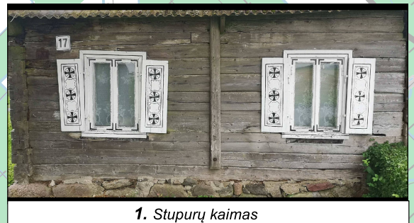
1. Stupurų kaimas

Topografiniai duomenys: GDR10LT © Nacionalinė žemės tarnyba prie Žemės ūkio ministerijos