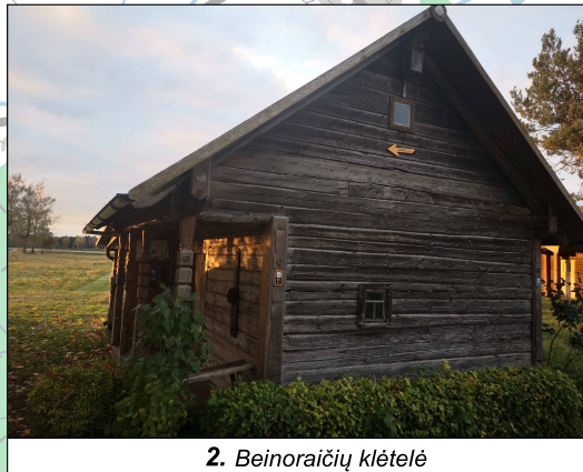
2. Beinoraičių klėtelė