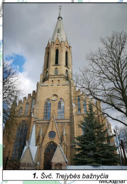
1. Švč. Trejybės bažnyčia