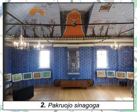
2. Pakruojo sinagoga