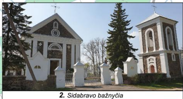
2. Sidabravo bažnyčia