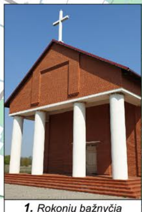
1. Rokonių bažnyčia