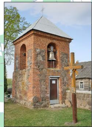
1. Vadaktų Šv. Agotos bažnyčios varpas