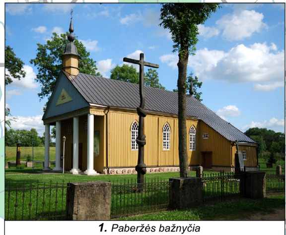
1. Paberžės bažnyčia

Topografiniai duomenys: GDR10LT © Nacionalinė žemės tarnyba prie Žemės ūkio ministerijos