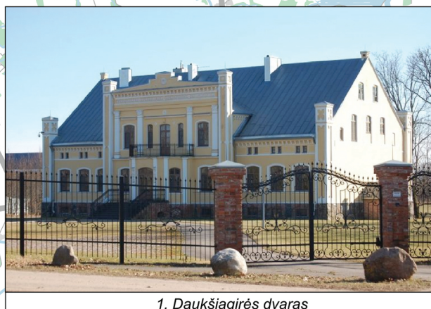
1. Daukšiagrės dvaras