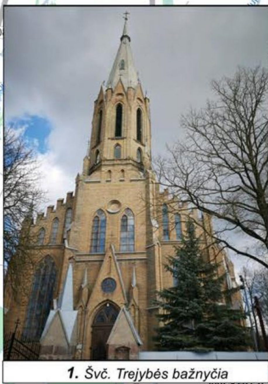
1. Švč. Trejybės bažnyčia