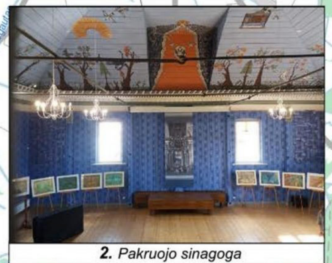
2. Pakruojo sinagoga