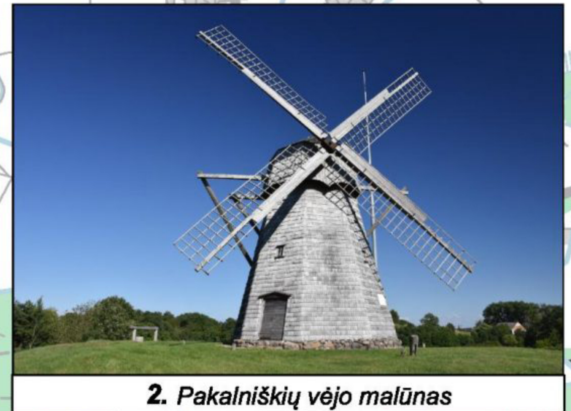
2. Pakalniškių vėjo malūnas