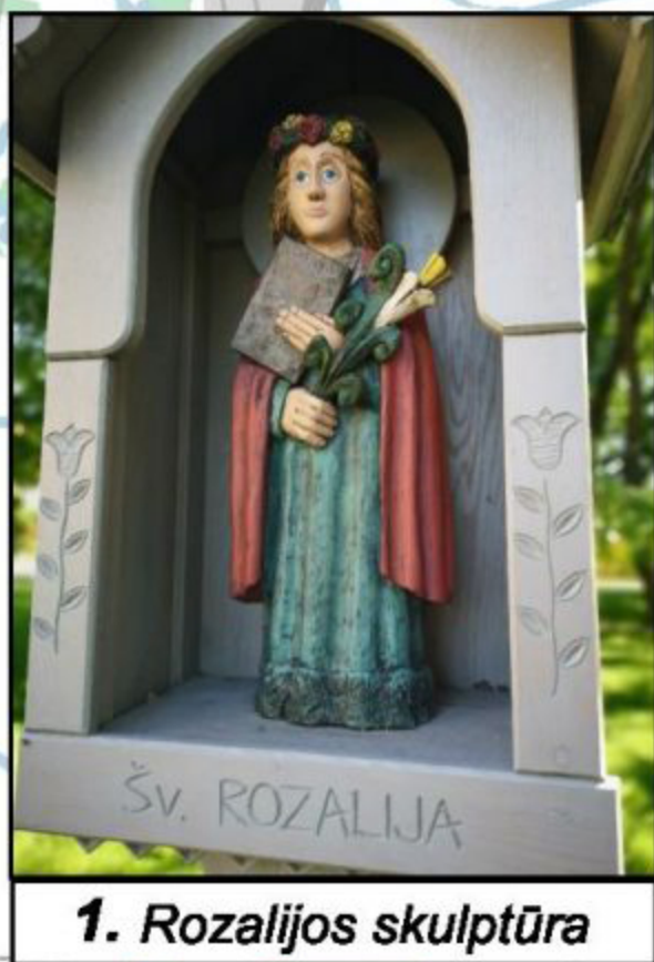
1. Rozalijos skulptūra