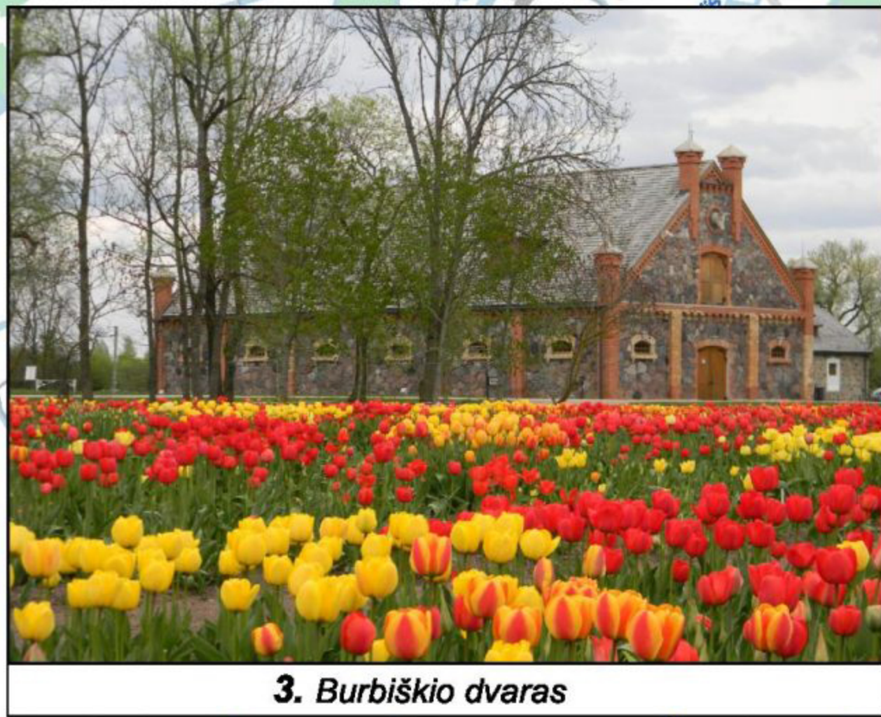
3. Burbiškio dvaras