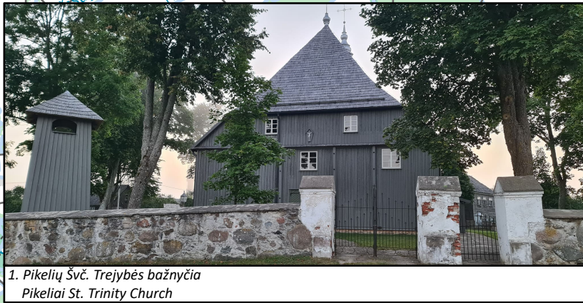
1. Pikelių Švč. Trejybės bažnyčia Pikeliai St. Trinity Church