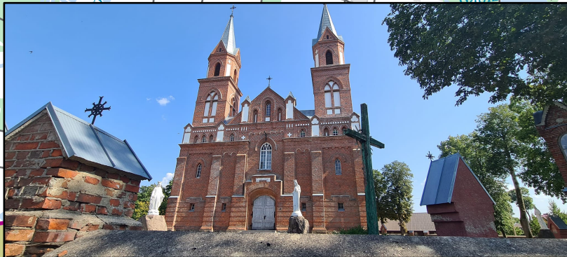
2. Ylakių Viešpaties apsirėškimo Švč. Mergelei Marijai bažnyčia Ylakai Church of the Revelation of the Lord to the Virgin Mary