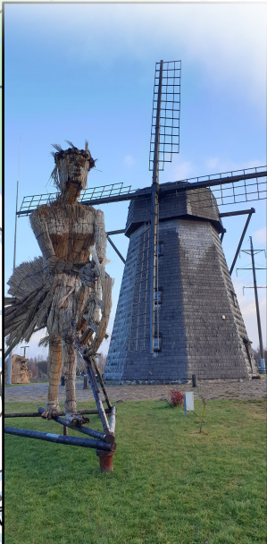
1. Žaliūkių vėjo malūnas Žaliūkės windmill