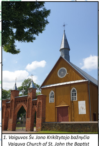
1. Vaiguvos Šv. Jono Krikštytojo bažnyčia Vaiguva Church of St. John the Baptist