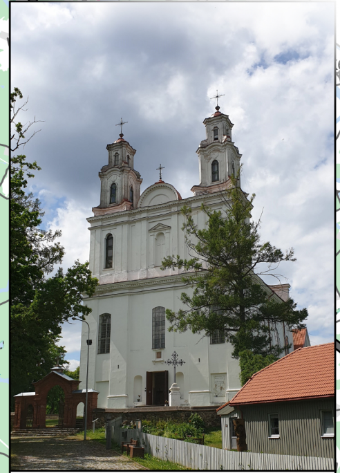
2. Kurtuvėnų Šv. apaštalo Jokūbo bažnyčia Kurtuvėnai Church of St. Apostle James