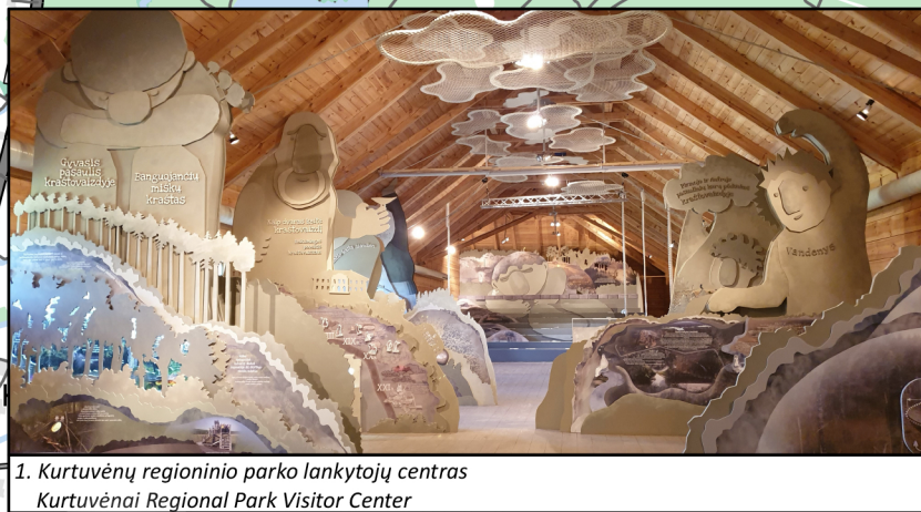
1. Kurtuvėnų regioninio parko lankytojų centras Kurtuvėnai Regional Park Visitor Center