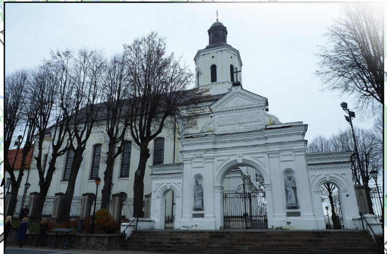
1. Telšių Šv. Antano Paduviečio katedra Telšiai St. Antanas Paduvietis Cathedral