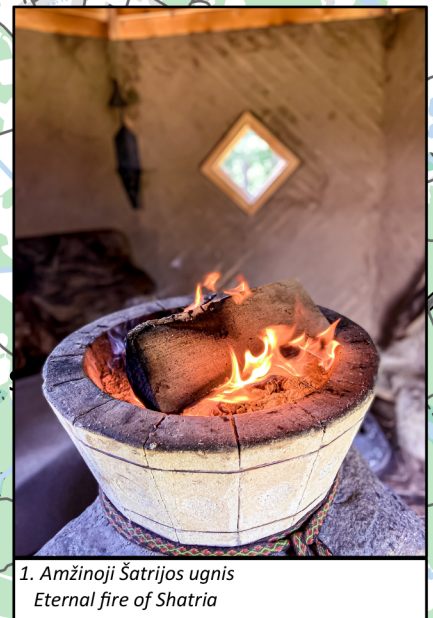
1. Amžinoji Šatrijos ugnis Eternal fire of Šatrija

Topografiniai duomenys: GRPK © Lietuvos Respublikos žemės ūkio ministerija, 2021