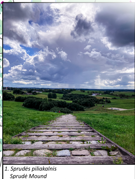
1. Sprudės piliakalnis Sprudė Mound