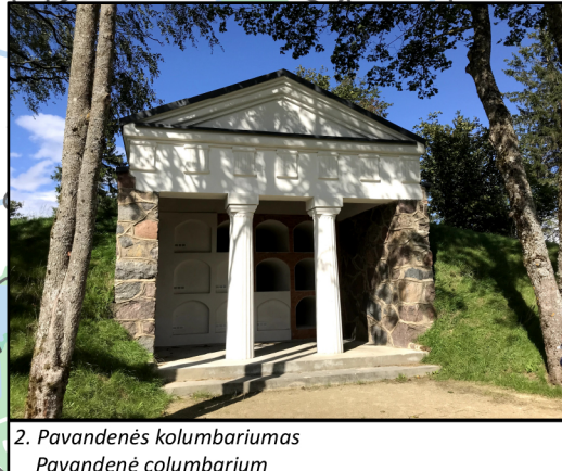
2. Pavandenės kolumbariumas Pavandenė columbarium