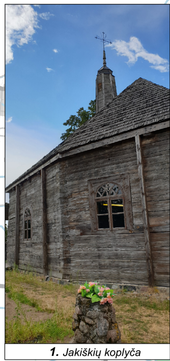
1. Jakiškių koplyčia

Topografiniai duomenys: GDR10LT © Nacionalinė žemės tarnyba prie Žemės ūkio ministerijos